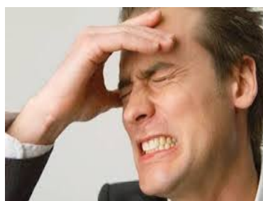
4) ANTON HA MAL DI .....