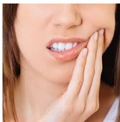
1) LARA HA MAL DI .....